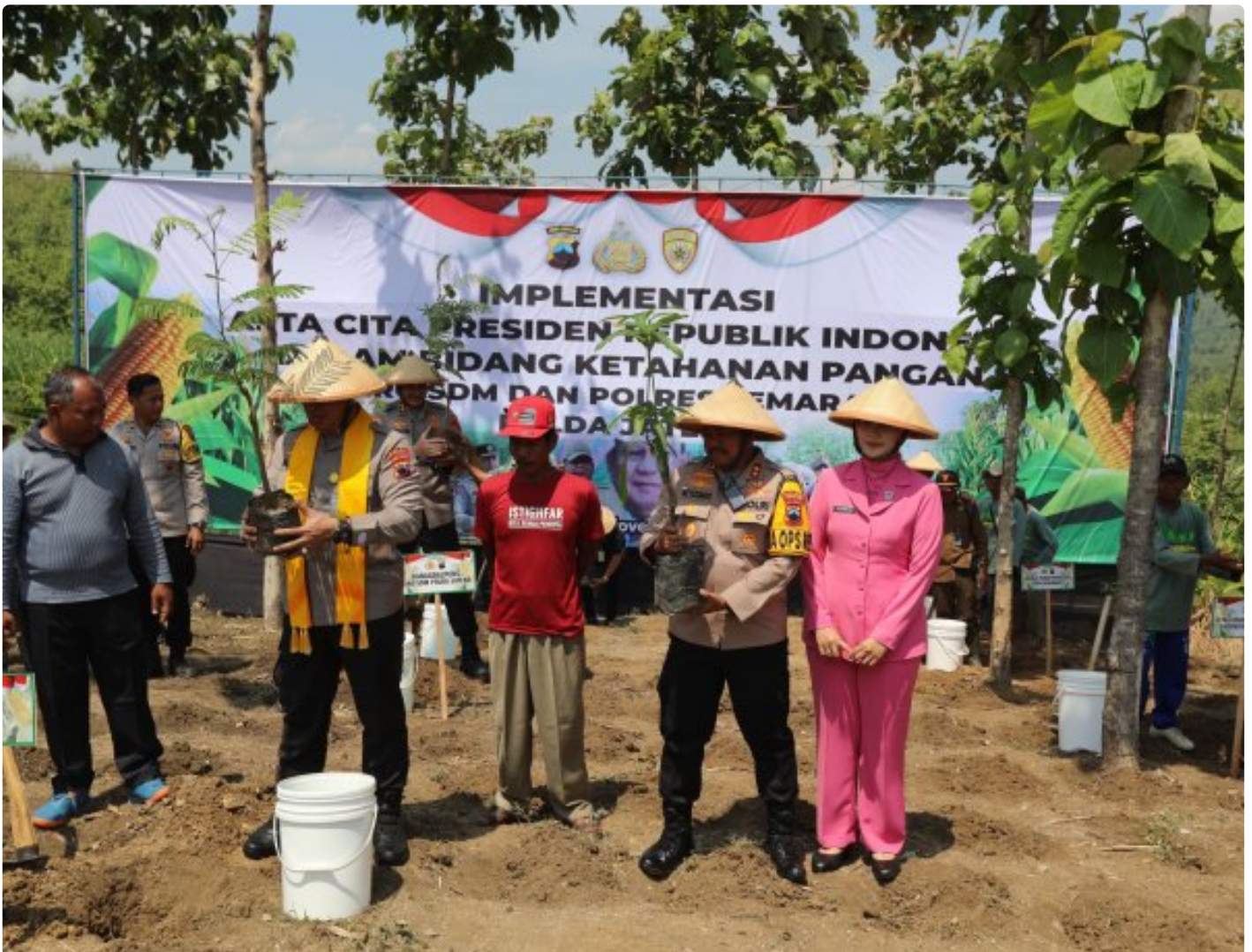
Foto: Polda Jawa Tengah menggulirkan aksi besar penanaman 1,8 juta pohon di seluruh wilayah Jawa Tengah. Pada Selasa (5/11/2024).

Kabupaten Semarang- Dalam semangat mendukung ketahanan pangan nasional dan kesejahteraan petani, Polda Jawa Tengah menggulirkan aksi besar